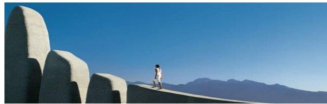
Ingineria și managementul producției materialelor metalice

Un element deosebit în pregătirea masteranzilor îl constituie analiza și prelucrarea imaginilor medicale de tip CT/MRI și simularea intervențiilor chirurgicale realizate cu un software specializat (MIMICS), ca și proiectarea informatizată și simularea eforturilor în elementele protetice realizate cu un alt software specific (ANSYS).