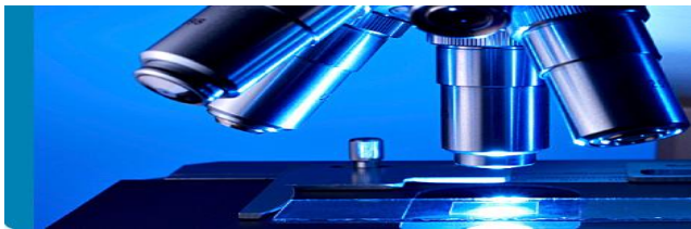
Știința și managementul testării materialelor

Programul de master complementar propus, este conceput astfel încât să asigure atât pregătirea științifică și tehnologică a cursanților, într-o gamă largă de încercări ale materialelor, cât și aprofundarea conceptului de management al calității.