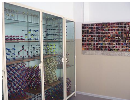
Modele tridimensionale de structuri atomice