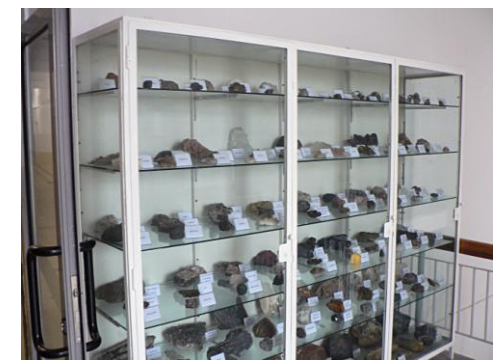
Colecția de minereuri