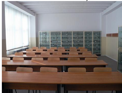
Laboratorul de cristalografie și mineralogie