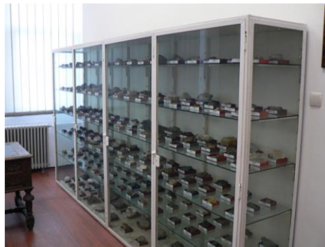
Colecția de minerale