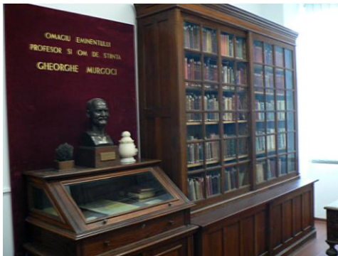
Biblioteca de mineralogie