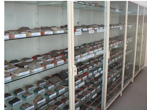
Colecția de roci